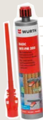
Lieblingsprodukt: Basic WIT-PM 200, da hält jede Befestigung.

Werner Ryser, Firmeninhaber der Schreinerei Ryser AG in Rickenbach.