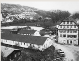
Im Gebäudekomplex der Schlossmühle in Künzelsau hatte die Firma Würth ihren ersten Firmensitz.