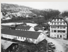
Le premier siège de l'entreprise Würth était installé dans les bâtiments de la Schlossmühle à Künzelsau.

Adolf Würth, le père de Reinhold Würth, fonde à Künzelsau , en Allemagne, une entreprise de commerce de gros pour les vis et les écrous.