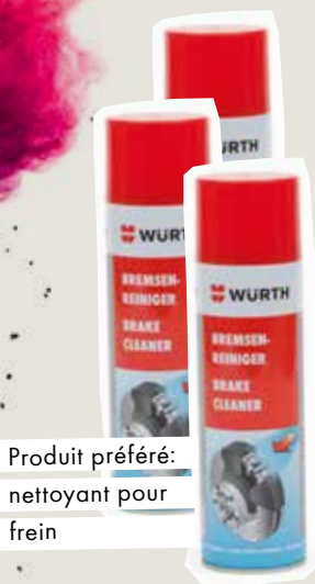
Produit préféré: nettoyant pour frein