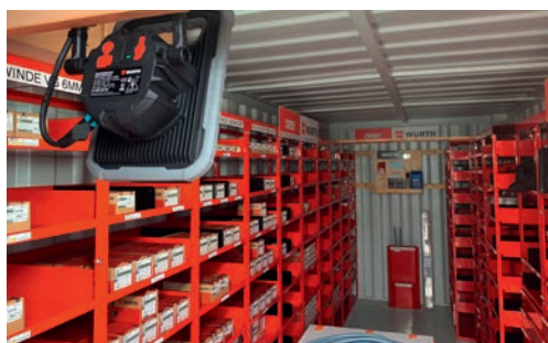
Projet de reconstruction Waldacker Saint-Gall avec 110 appartements